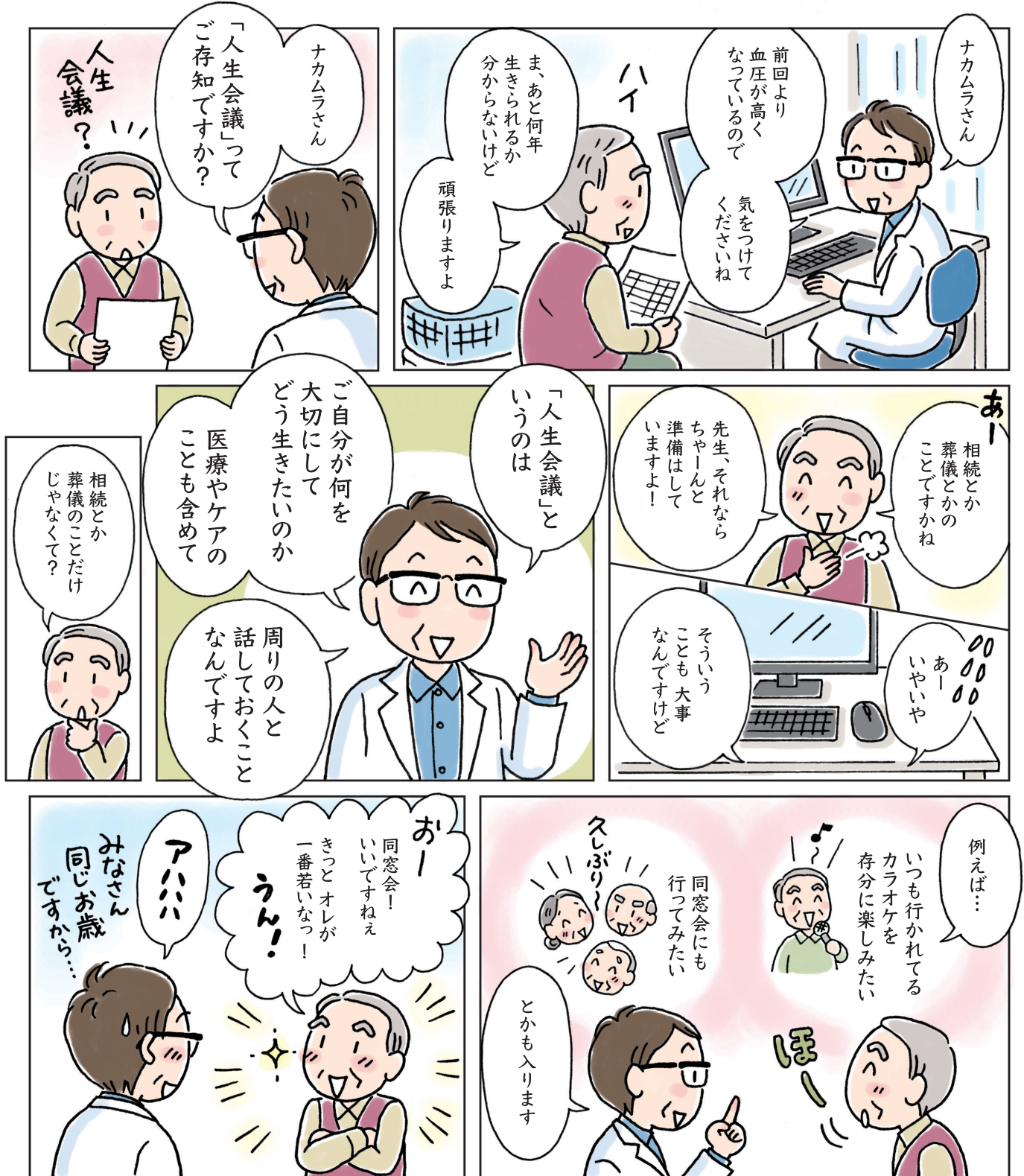
イラスト/漫画: 幡谷智子