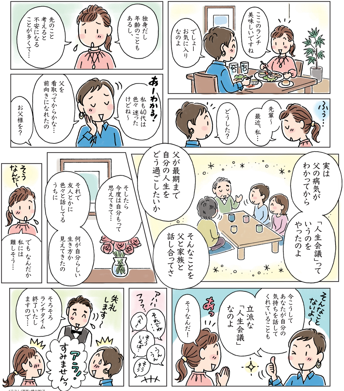
イラスト/漫画: 幡谷智子