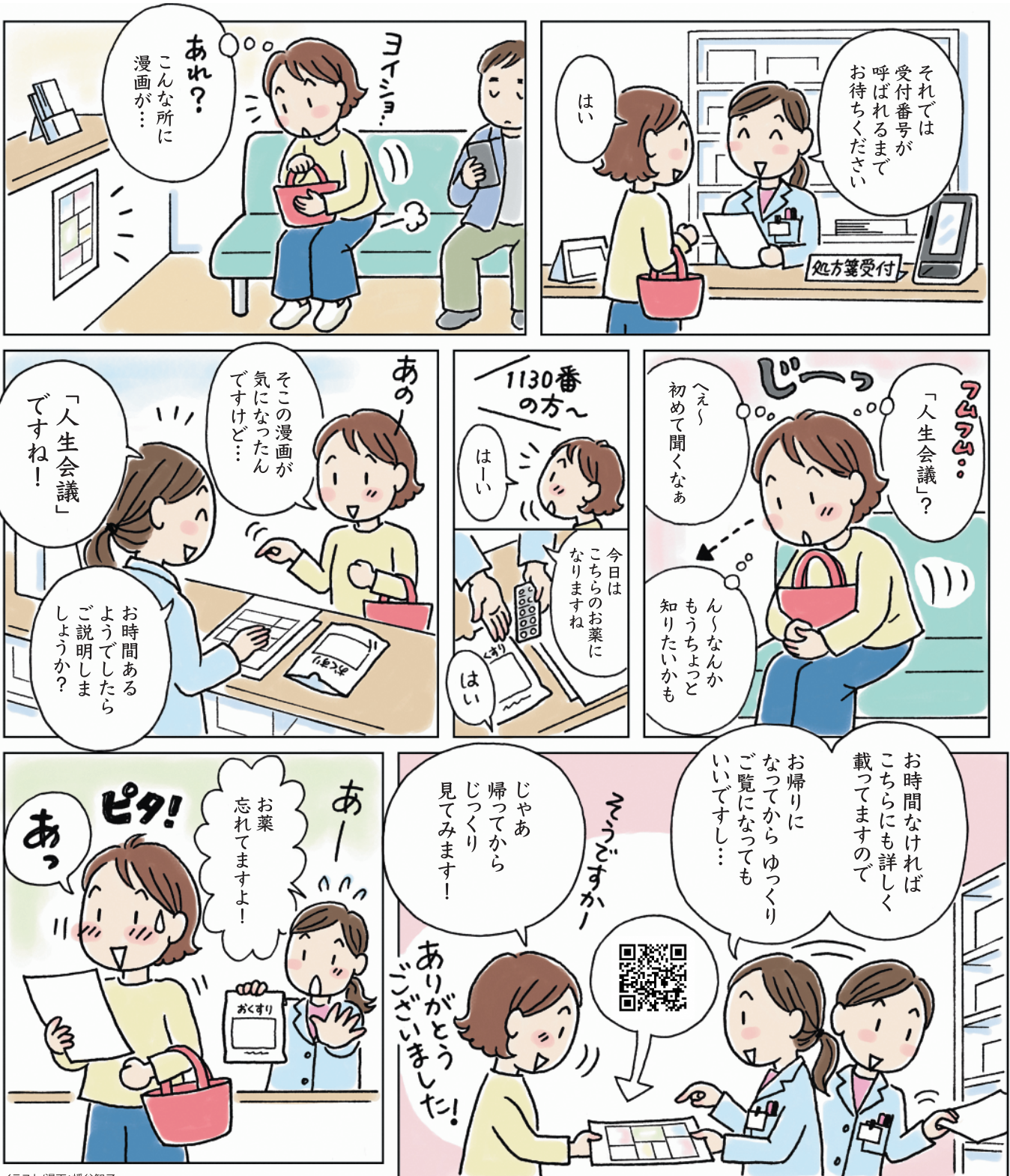
イラスト/漫画：幡谷智子