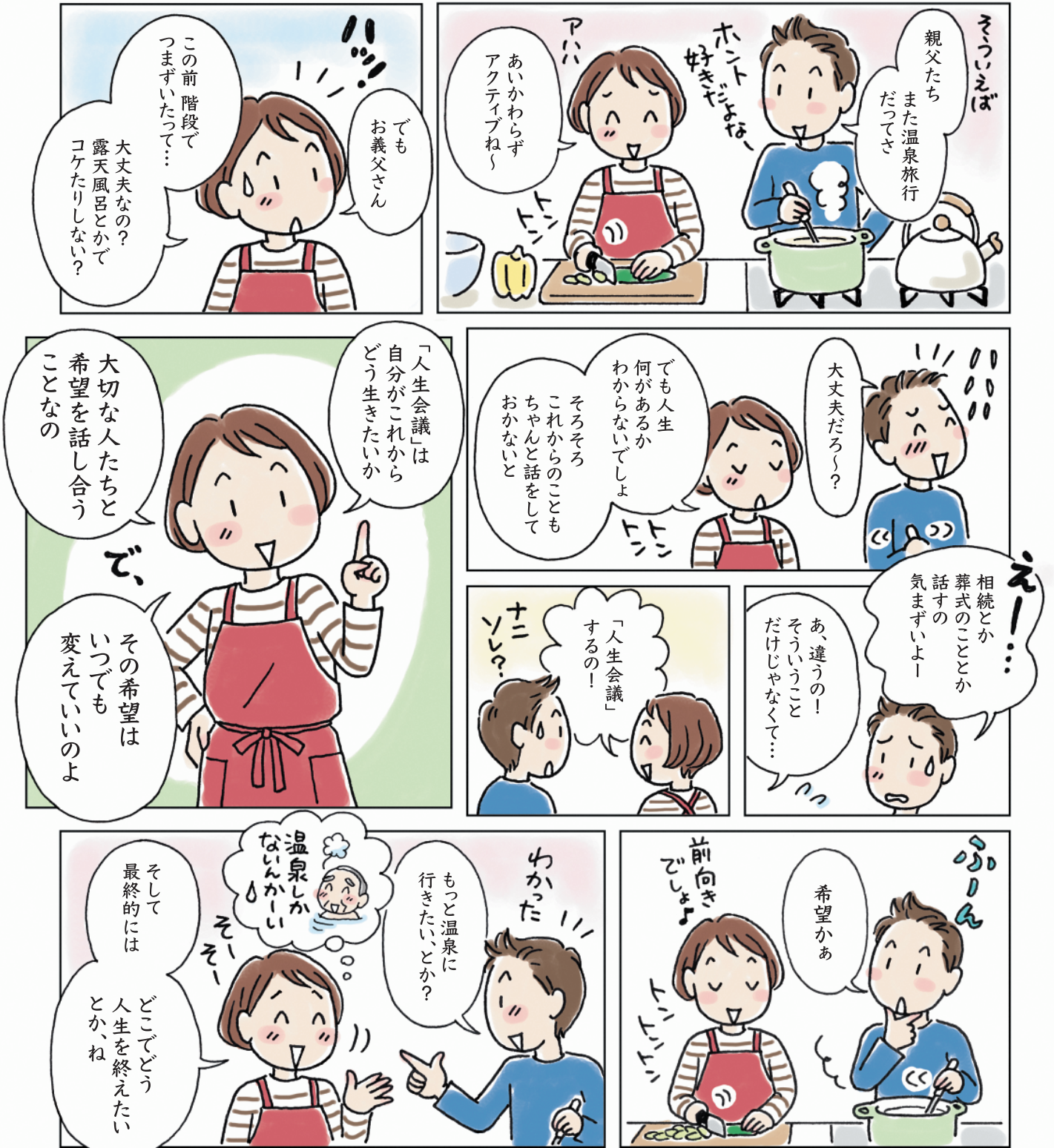
イラスト/漫画：幡谷智子