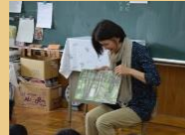
図書の読み聞かせ