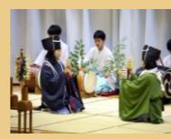
地域行事・伝統芸能の継承