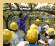
ゲストティーチャー・学習支援