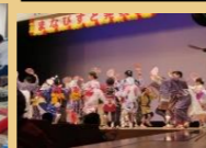
さまざまな体験活動