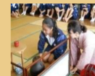
中学生職場体験活動