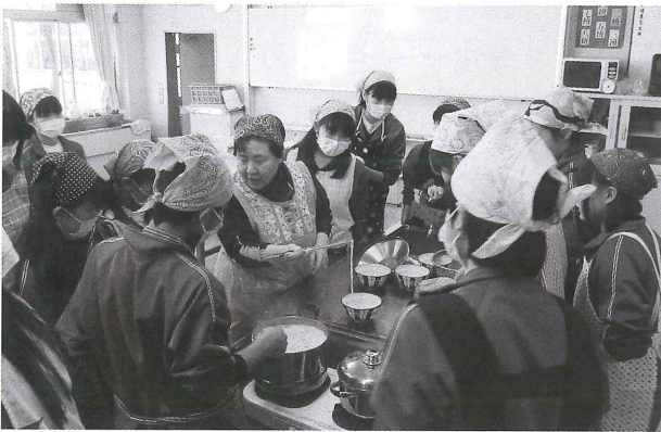
【菖蒲中学校の授業風景】

子どもたちの健全育成は、私たち大人の恒久の課題であります。近年、久喜市では暴力行為やいじめ問題、地域での迷惑行為や家庭への引きこもりなどが課題となっております。学校では、道徳教育や人権教育の推進をとおして子どもたちの道徳心や人権意識を高め、生徒指導上の諸問題を未然に防ぐ取組を行っております。さらに学校の力だけでなく、家庭・地域と連携した活動を進めています。