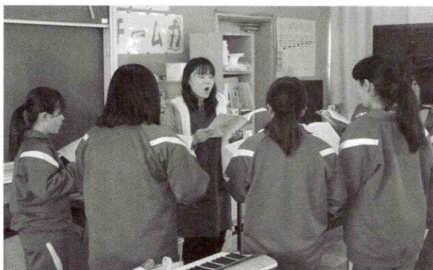
【久喜南中学校の授業の様子】

子どもたちの健全育成は学校・家庭・地域の「恒久の課題」です。そのためにも、いじめ・不登校・暴力問題といった生徒指導上の諸課題に、未然防止、早期発見・早期対応の処置が求められます。近年、久喜市ではいじめの認知件数が増加していますが、学校や家庭、地域で、子どもに関わる大人の「いじめの見逃し」が減少していることが要因と考えます。