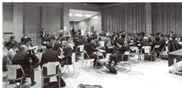
【推進委員会の情報交換の様子】

本校の生徒指導の基本「早期発見・早期指導」「関係プレイ」「接触の量の多さ・フットワーク」「共通行動」「繰り返し指導」に関わる具体的な取組は、各学校でも大いに参考となるもので、有意義な研究発表となりました。