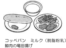
コップパン ミルク(脱脂粉乳) 豚肉の竜田揚げ せんキャベツ ジャム

◆昭和29年に学校給食法制定されました。学校給食が食育活動の一つに位置付けられました。主食はコップパンが多くごはんや麺はほとんどでませんでした。