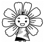
久喜市立小・中学校マスコットキャラクター「はびるん」