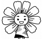
久喜市立小・中学校 マスコットキャラクター 「はびるん」