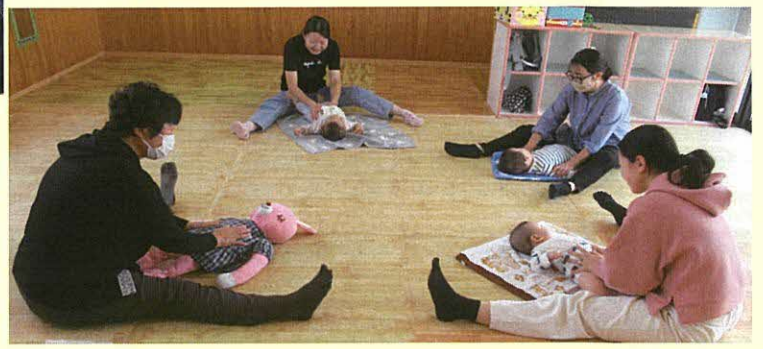
さくらだ・まめっちょ