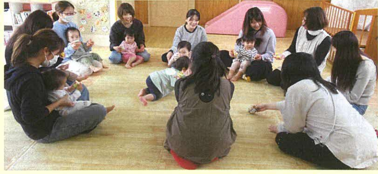
親子でリズムック