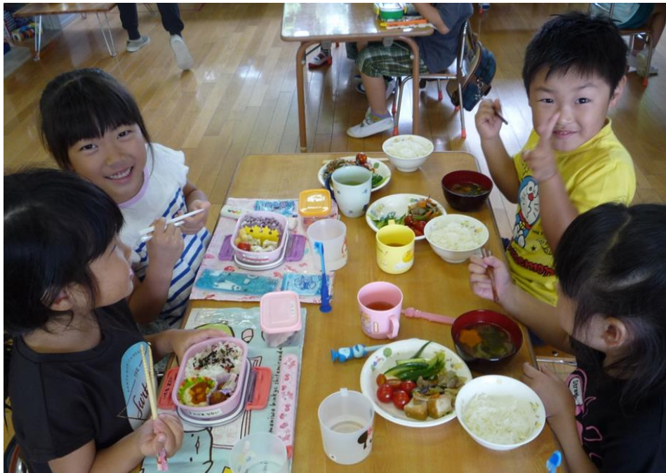
中央幼稚園と中央保育園分園の幼保給食 (中央幼稚園)