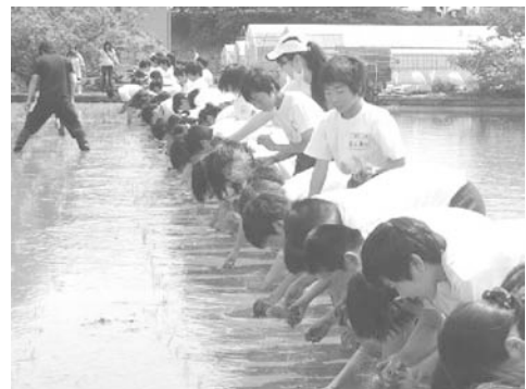
〈5年生の田植え体験〉