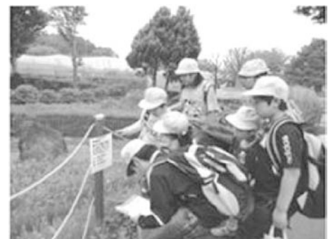
「全校徒歩遠足」縦割り班でオリエンテーリングを楽しんでいる様子