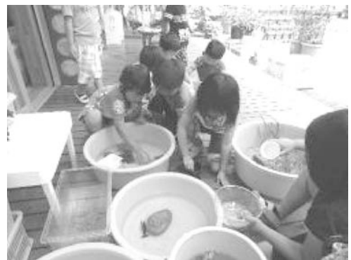
園の近くで捕まえたり、家庭から届いたザリガニやオタマジャクシで遊んだりしています。