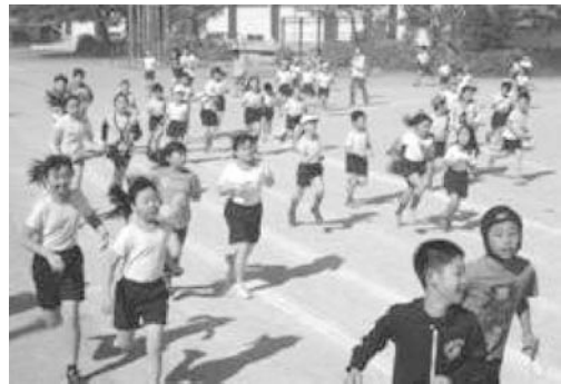
朝トレチャレンジ（教師も一緒にマラソン）