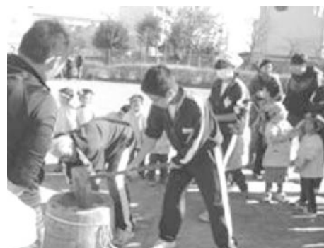
保育園での世代間交流事業 (もちつき大会)