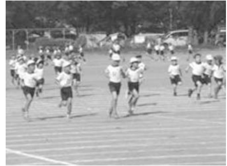
朝マラソンの様子