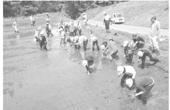
新潟県十日町市赤倉地区での自然体験教室