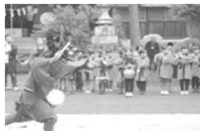
<小林神社でのささら奉納>

※凡事徹底し子どもとともに学ぶ、豊かな人間性を備えた使命感と情熱を持った教師集団がこの目標を具現化していき「子どもあるところ、教師がいる学校」「知恵を出し、汗をかき、夢の持てる学校」を作り上げる。