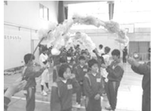
「新入生を迎える会」