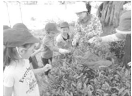
<お茶摘み体験：1年生>