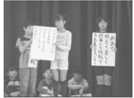
児童集会 各クラステーマ発表