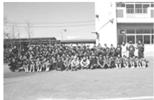
芋煮会の後、学校ファームにて