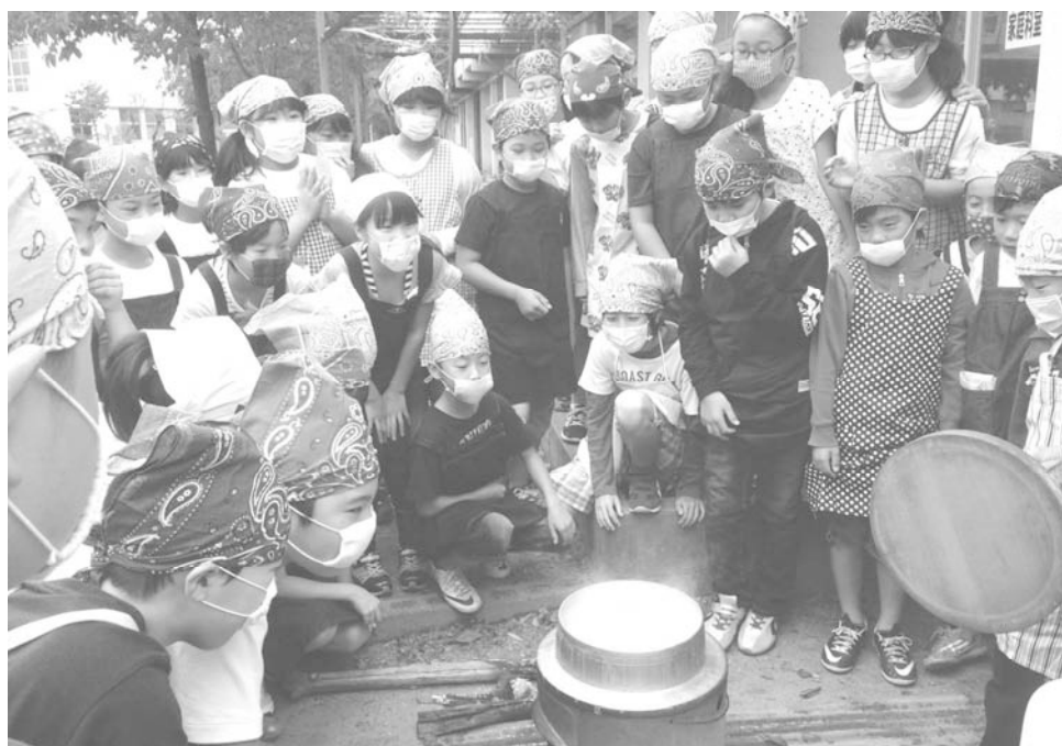
お米収穫祭(砂原小学校)