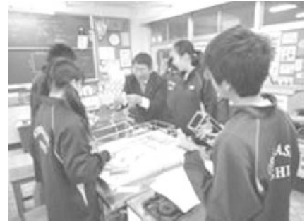
セキスイハイムとコラボしての協調学習 家庭科「環境にやさしい家づくり」