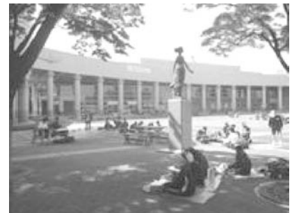
郷土を描く写生会の様子 (久喜市総合文化会館にて)