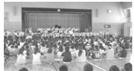
平成 2 6 年度 小中音楽交流会