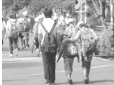
＜「かがやき班」で東武動物公園へ＞