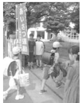
[あいさつ運動の様子]