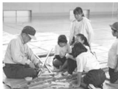
<ふれあいフェスティバル：竹馬づくり>