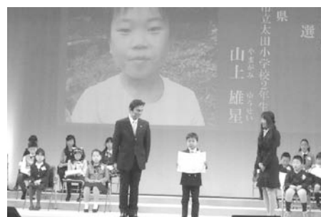
しきなみ子ども短歌コンクールでの表彰