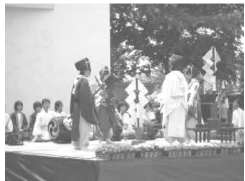
土師一流催馬楽神楽「郷土芸能部」