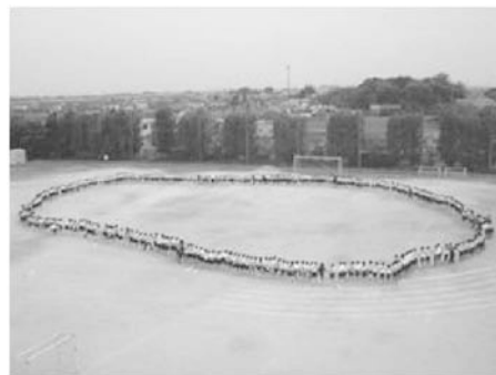
▲体育祭に向けて、全校生徒と教員で つくった円陣です