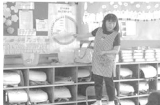
「食育（パクパクタイム）：バランスの良い食事を知る」