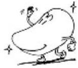
上内小マスコット キラキラくん