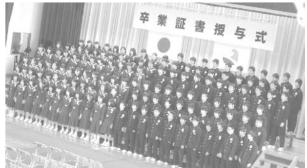
【卒業式での3年生の全員合唱】

これを「Taitou Students' Story (太東中生徒の物語)」と称し、段階的な「当たり前のこと」の向上を目指し、卒業時にはすべての項目について「できる」こと、そして将来に向けて、さらに当たり前の「高み」に挑戦する姿勢を持って巣立つという、一連の物語(Story)にしました。