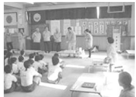
しずかっ子元気ゆうゆうプラザ説明会