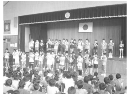
音楽朝会（音楽と音読の発表・毎月）