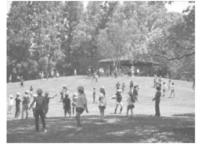
縦割り班の全校遠足

*「笑顔 あいさつ ありがとう」いきいきと輝く児童を育む学級経営を基盤とし、確かな学力の育成と心の教育の充実、体力と気力を育む教育を全学年において教師が一丸となり推進する*