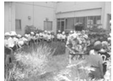
ビオトープを活用した環境学習

教えるべきことを確実に教え、さまざまな体験を通して考える力を鍛え、児童が伸びる環境づくりをする。