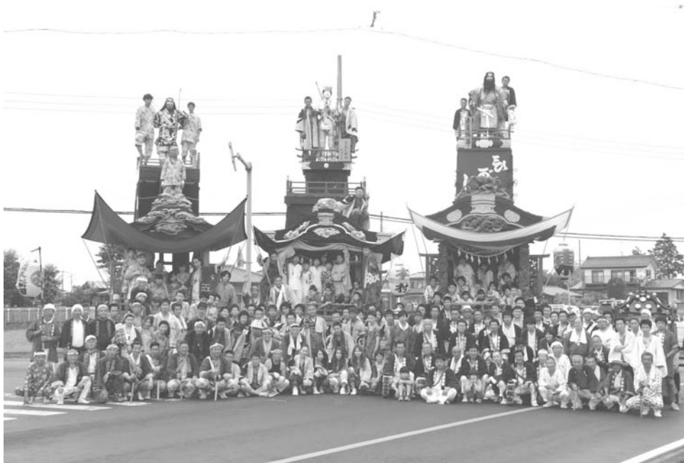
上清久八坂神社の山車行事(天王様)