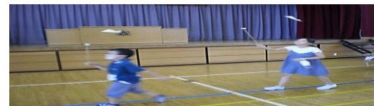
ふわふわ風 土曜教室 たのしかったです。8の字がうまくとんだ がうれしかった。(1年生)