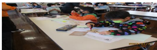
ミニ工作 土曜教室 やってみてとてもたのしかったです。 これでいっぱいあそびたいです。(2年生)