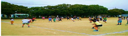
ドッジボール教室 木曜教室 もっと、積極的に取ったり投げたりしたい。 (6年生)