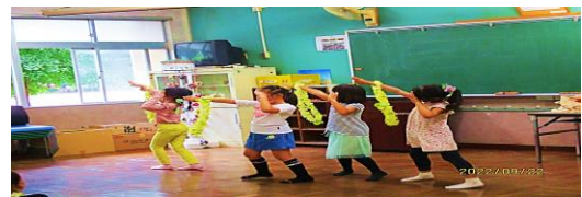
フラダンス 木曜教室

上手につくれて、うれしかったし、できたときに、ほめられてうれしかったです。(4年生)