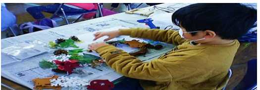
クリスマスリース 土曜教室 一度目とちがうできになり、また、きれいに できたので、かざりたいです。(5年生)