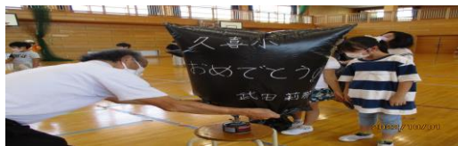
楽しい理科実験 土曜教室 火にかけると、ビニールがとんだのでびっく りしました。なかなか火の実験はできないの ではじめてでワクワクしました。(4年生)