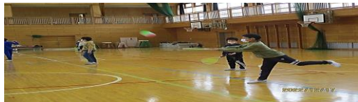
ミニテニス 土曜教室 ミニテニスで前よりもうまくなっていくなか まを見てうれしくなりました。自分もどんど んうまくなってたのしかったです。(6年生)