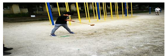
グラウンドゴルフ 木曜教室

わたしはダンスをやって、ちょっとむずかしかったけど、楽しかったです。来年もダンスを作ろうやりたいです。(2年生)