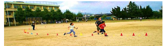
陸上 土曜教室 きょうはりくじょうをやりました。リレーで 一ばんはとれなかったけど、つぎはがんばり たいです。(2年生)