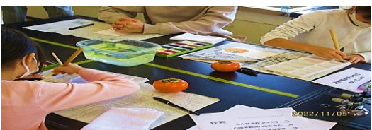
絵手紙 土曜教室 さいしょはじょうずにかけなかったけれど 先生のいうことを聞いてやったらさいご の一つはじょうずにできました。(3年生)