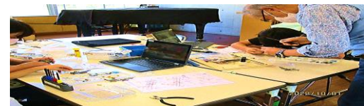
ロボットを作ろう 土曜教室 工作とかは苦手だったけど、サポーターさ んといっしょにやったらうまくなりました。 (4年生)