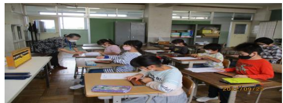
そろばん 木曜教室

図書室で本や宿題ができて、とても勉強する環境が整っていたので、勉強することができました。(5年生)