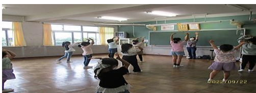
ダンスを作ろう 木曜教室

わたしはダンスをやって、ちょっとむずかしかったけど、楽しかったです。来年もダンスを作ろうやりたいです。(2年生)