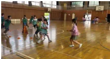
スポーツ鬼ごっこ