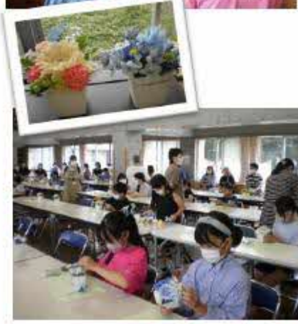
かわいい花アレンジ