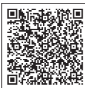
情報提供はこちらから

※ホームページをご利用の場合、パソコンやスマートフォンから24時間いつでも可能です。