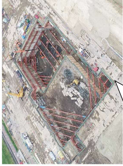
建物の基礎部分を掘削しているときの様子 (令和6年2月)