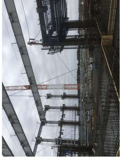
(参考)水戸市清掃工場の 建設工事の様子