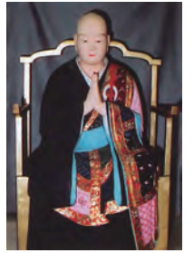
⑫-3 木造単信上人椅像 (非公開)