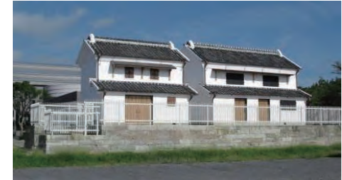
向かって左が「大蔵」、右が「向う蔵」

旧栗橋宿内の江戸時代末期の水塚を移築・復元したものです。市内で唯一残る商家の水塚です。水塚の蔵内では、栗橋地区の歴史や民俗、水害に関する資料をご覧になれます。