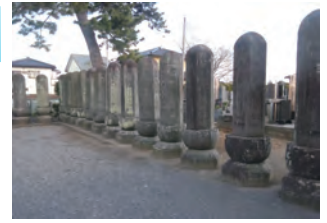
⑫-1 深廣寺・六角名号塔