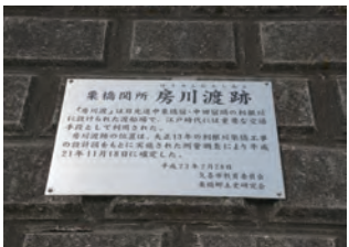
⑥ 房川渡し跡 (案内プレート)