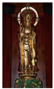
④ 経蔵院・乾漆地蔵菩薩立像 (非公開)