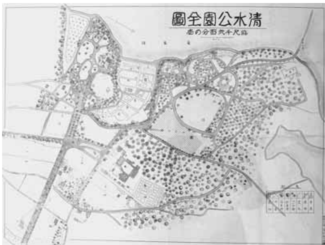
昭和12年に写された清水公園全圖