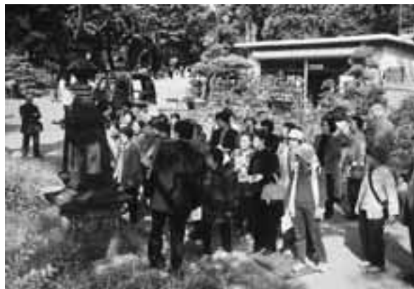
日比谷公園に残る開園当時の「水飲み」を見学しているようす

平成十五年度は十月十八日土曜日に、昨年同様、町バスを使って日比谷公園、明治神宮、そしてNHK菫蒲久喜ラジオ放送所のご協力を得て、NHK放送センターの特別見学という内容で実施されました。特に今回は日比谷公園開園百周年を記念したガーデンングショーに菫蒲町が出展していることもあって、