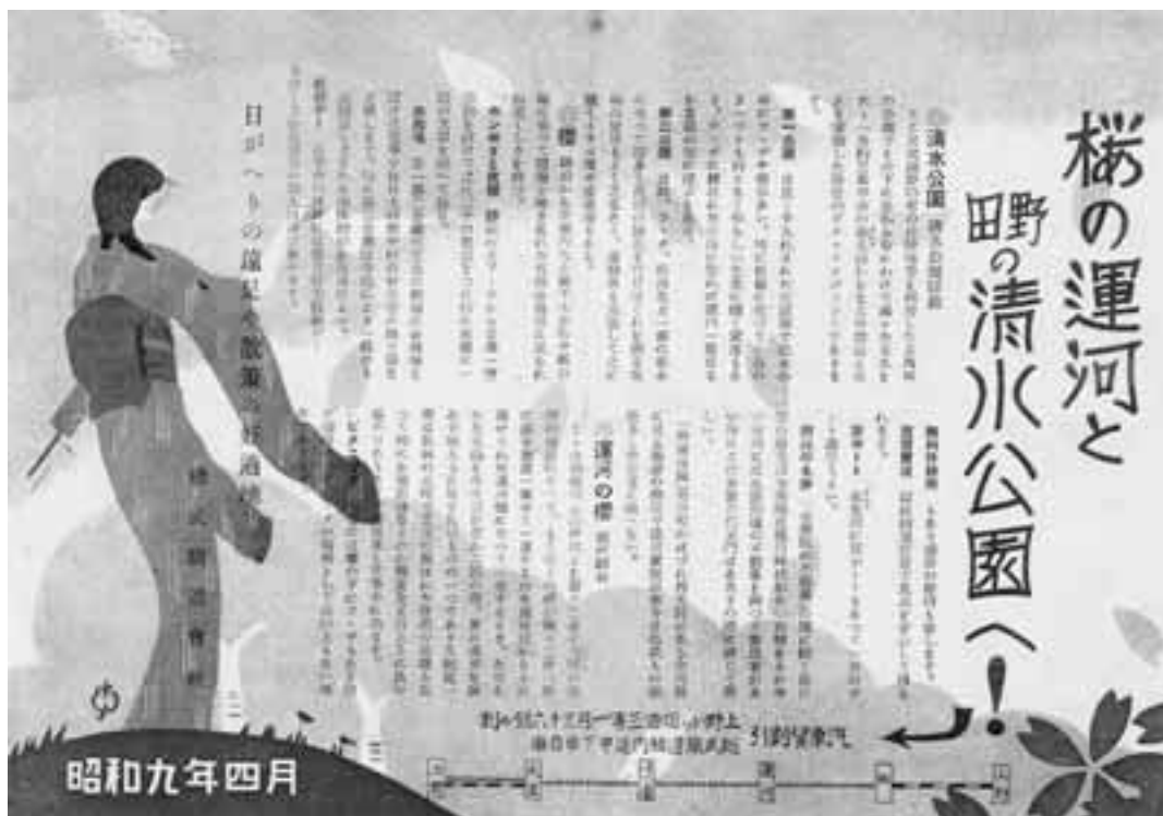
昭和初期の清水公園をPRするチラシ