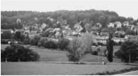
本多静六がよく散歩に出かけたというハルタ村