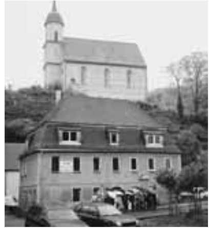
本多静六が下宿した民家（手前）や教会（奥上）が当時の姿のままある

た。ターラントはドレスデンの南西約十五キロメートル、車で約三十分の距離にある。天気は今にも降り出しそうな空模様である。一行は駐車場にバスを止め、二百メートルほど離れた町役場庁舎へと徒歩で向った。