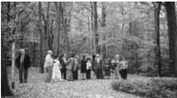
ターラントの森 写真右下はハインリンヒ・コッタの墓