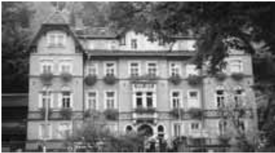
ターラント町役場庁舎