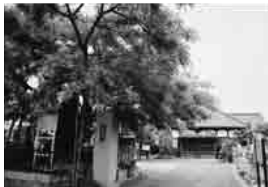
博士が学んだ幸福寺（久喜市菖蒲町河原井）

また、旅好きの静六博士は、海外に旅すること十七回、各地を旅したそうですが、その際、ベルト