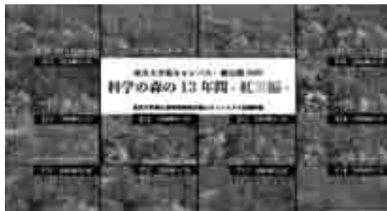
秩父の森の13年間の映像を公開。1年の中で葉の色の様子や年ごとの紅葉・落葉の比較が可能