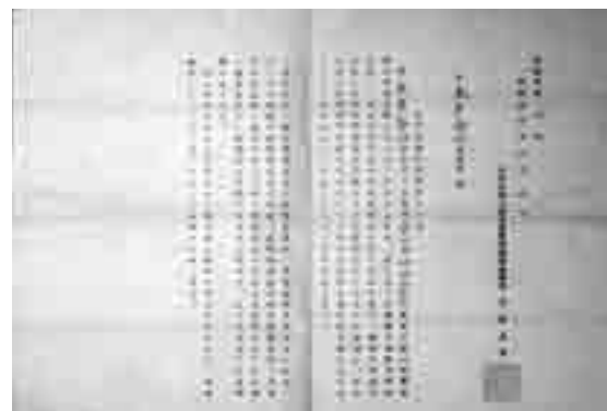
保留勲章の伝達について

理大臣官房賞勳部庶務課長が通知した文書です。この文書から「勲章の在庫の不足は戦時中造幣局が空襲を受け又疎開したことなどに遠因し、その後連合軍司令部の意向によつて勲章の製作が全面的に禁止せられること、なりいよ不足」していったと書かれています。さらに「独立後は、極力関係官庁と折衝を重ね、早期解決」に務めてきたが「終戦以来特殊資材の不足、造幣局空襲以来の機能復旧、予算関係等諸種の事情」によつて遅くなつてしまつたが「漸く褒賞物品の一部製作が可能になりましたので、こゝにお渡しする」と書かれています。この資料は、単に勲章の伝達が遅れたことだけではなく、その理由として第二次世界大戦による造幣局の被害及び疎開による混乱、終戦後、占領下では連合軍最高司令官総司令部（GHQ）から勲章の製作が禁止されていたこと、独立後（いわゆるサンフランシスコ講和条約締結後）においても資材の不足などでも思うように勲章などの製作ができなかつたことなど当時の社会情勢