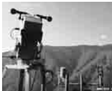
秩父演習林内の定点観測ロボットカメラ

小中学校を対象として、蓄積された映像・音声を利用した遠隔授業を実践するなど、ユニークな環境教育を行っています。