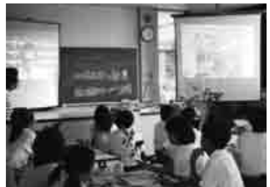
東京大学と小学校をネットワークで結び、秩父演習林のブナ林の資料映像を教材配信して、遠隔授業を実践