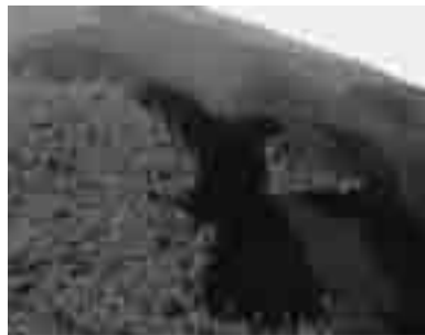
蓄積されたデータを基に、過去・未来の森林の姿をCG化(2001年 秩父演習林)