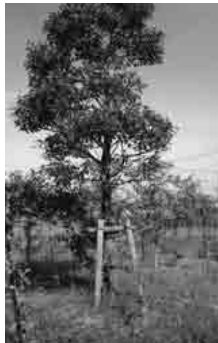
平成23年9月 クスノキ

先祖は台湾、中国南部からやって来たと言っています。関東も利根川から北は苦手です。それにしても菖蒲の冬は特に厳しいです。どうなる