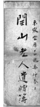
開山老人遺贈簿(迦葉院藏)