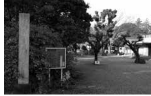
総寧寺 (千葉県市川市国府台)

江戸時代には各宗派の本山を定め、その下に末寺を置く本末制度が整備された(曹洞宗は永平寺と総持寺)。また、地域内の寺院を支配する僧録制度がひかれた。大僧録として全国の曹洞宗寺院を支配したのが総寧寺、大中寺(栃木県下都賀郡大平町)、龍穩寺(埼玉県入間郡越生町)の関三箇寺であった。