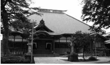
満福寺（秋田県横手市増田町増田）

昭和60年頃まで山門楼上には、黙山元轟が示寂する4ヶ月前の宝暦13年7月に揮毫した「増田山」の山号額が掲げてあった。平鹿地方（現在の横手市周辺）に末寺15ヶ寺を有し、当地方における曹洞宗の中心的な寺院となっていた。