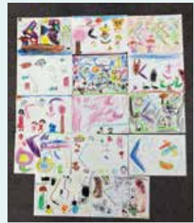
どれも素敵な作品でした♪