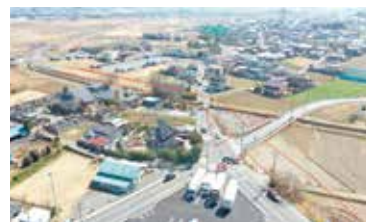
早期の整備が求められる（仮称）白岡久喜バイパス

答 令和3年度末の用地取得率は82.2%、工事進捗率は4.3%であります。課題は県道春日部菖蒲線と県道上尾久喜線の双方に下水道管や通信ケーブルなどの地下埋設物が多く、関係機関との調整作業と残る地権者の協力を得ることに苦慮している。令和4年から約3年かけて、弁天橋、正楽寺橋の架け替え工事を予定している。