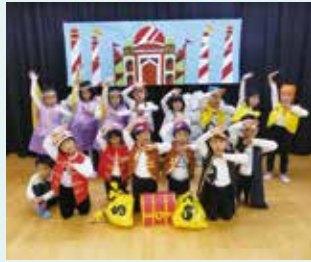
みんなでがんばりました♪