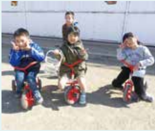
お外遊び楽しいね♪