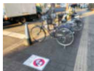
駐輪禁止区域に放置された自転車

問 駅前の放置自転車が後を絶たない。現状の対策を強めるだけでは限界がある。発想を転換し、駐輪されやすい階段の下などのデッドスペースに、駐輪ラックを設置してはどうか。何もなければ、無造作に自転車が放置されるのであって、傍らに駐輪スペースがあれば、心理的な障壁が生じるのではないかと。財源確保にもつながる。