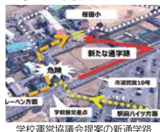
学校運営協議会提案の南通学路

答 学校や学校運営協議会の要望を伺い、庁内関係部署と協議する。通学路と決まれば、現地調査のうえ水路の整備や地権者のご意見を伺う。