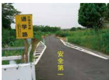
河原井地区の農用地の保全と 集落内の環境整備

つ、やっとなつけた防犯灯だが、山王橋付近は電線が足りない。もう一つは、水路に沿って雑草の未処理。大切な子供の事、何とかしていただきたい。