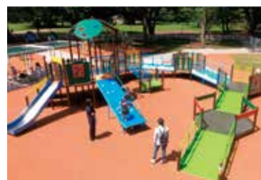
誰もが遊べるインクルーシブ遊具

答 子供からお年寄りまで、安全に楽しく過ごせる公園へのリニューアル工事を計画している。