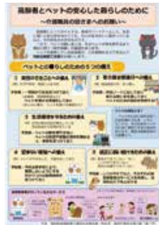
福岡県の「高齢者とペットの安心した暮らしのために」のチラシ

問 要支援、要介護認定者がペットを飼っている場合、積極的な情報把握を行い、事前の備えに不安がある人には、専門家やボランティアと連携できるサポート体制を、福祉部門・環境部門が連携し構築すべき。