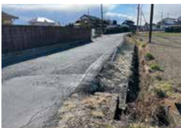
太田袋地区の修繕が必要とされる道路

問 太田袋地区は、道路の整備状況が他地区に比較して全体的に整備が遅れているとの指摘を受ける。路面の状況も修繕が必要とされる箇所も多く、側溝整備がされていない状況が散見されるが、どの様に把握されているのか伺う。