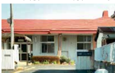
1984年に建設された障害者施設「いちようの木」