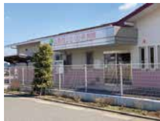
現在公立のさくら保育園

答 公立保育園は6園、民間保育所等は39園ある。民間では多くの児童を受け入れ柔軟、適正な保育を行っている。総合的に勘案し、民間活用とした。