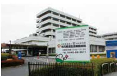
移転する済生会栗橋病院

答 秋谷病院が開院して病棟をどう使うか考えていかれるものと考えており、それを見守りたい。