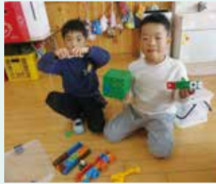
ブロックで何でもつくれるよ♪