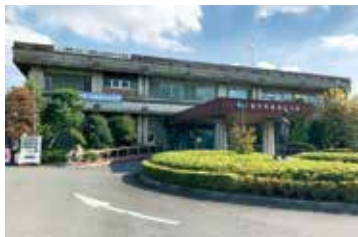
計画通り除却される栗橋総合支所

答 集会所周辺の区長に連絡したところ、市役所でやってくれて安心したよとのこと意見を伺った。