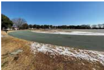
活用調査が始まる久喜市総合運動公園

答 令和4年度に実施する基本設計修正業務委託において、スポーツ、レクリエーション、コミュニティの拠点としてさらに充実を図るため、整備要望のある市民グラウンド、未整備となっている多目的広場及び老朽化の進んでいる市民プールの活用などについて検討していく。