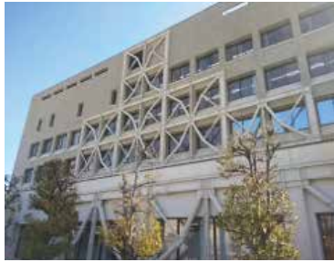
2015年に12億円かけ耐震化した本庁舎

問 2015年に耐震化したばかり、建て替えに85億円以上かかる。財源の無駄で中止すべき。