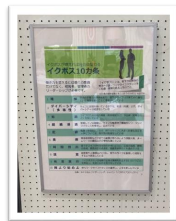
▲イクボスについて