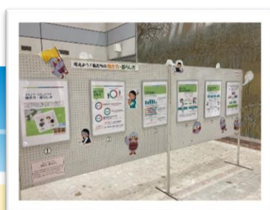
▲葛浦総合支所 1階ロビー