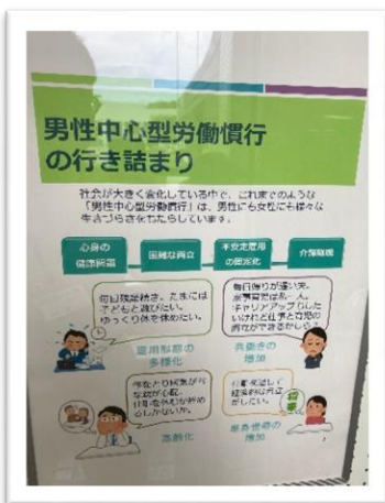
▲男性中心型労働慣行の行き詰まり