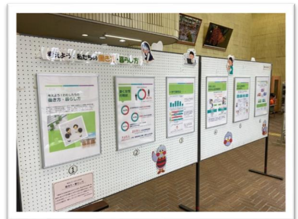
▲パネル展示の様子

従来の男性中心型労働慣行を見直し、性別に関係なく、すべての人が「仕事」と「仕事以外の活動」が両立できるよう、「ワーク・ライフ・バランス（仕事と生活の調和）」や、多様な働き方を紹介しました。