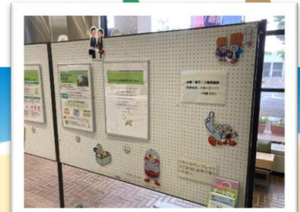
▲久喜市役所 1階ロビー