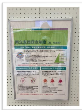
▲両立支援制度の紹介