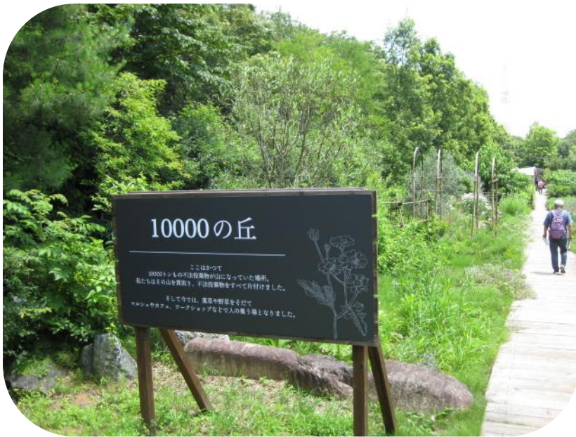
▲三富今昔村(見学の様子)