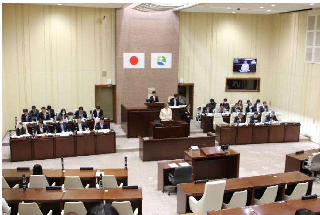
▲2023 久喜市いきいき女性議会が開催されました。詳しくは④ページへ。

今年度は約3年ぶりにすべての事業がコロナ禍前と同様に実施できたため、沢山の方に参加していただきました。