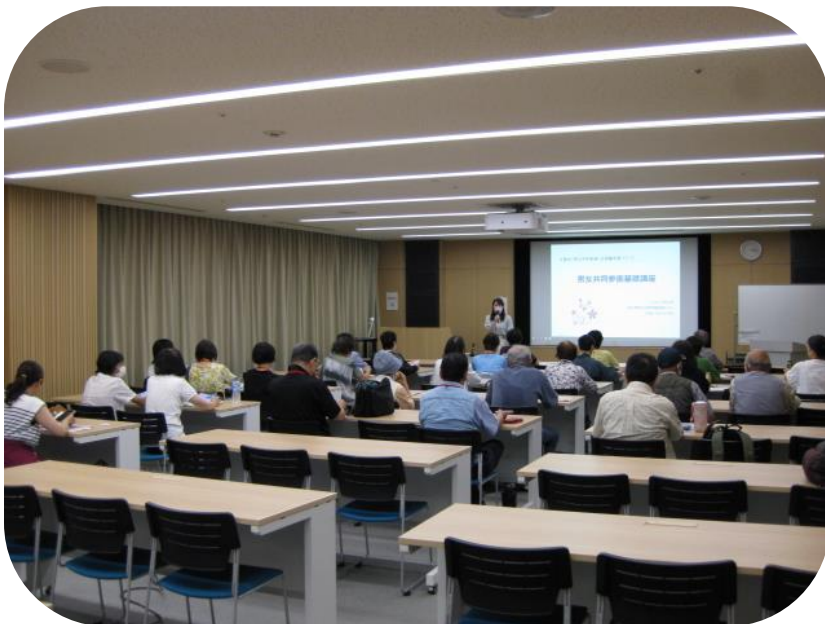
▲WithYou さいたま(講座受講の様子)