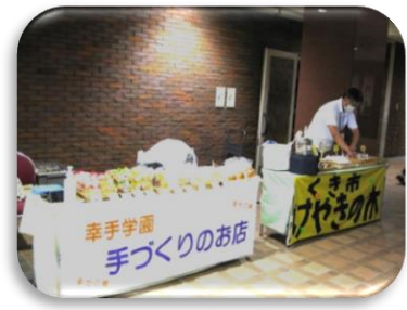
▲物品販売コーナー

令和5年6月24日(土)、久喜中央コミュニティセンターにて「令和5年度男と女のつどい」を開催し、307名の方にご参加いただきました。