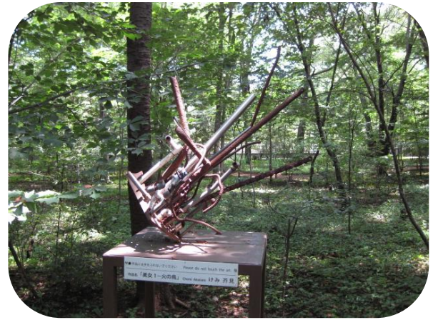
▲三富今昔村(モニュメント)