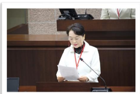
▲質問する女性議員