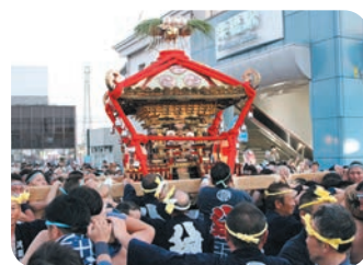
くりはし夏祭り「天王様」