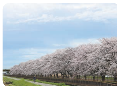
桜（見沼代用水沿い）