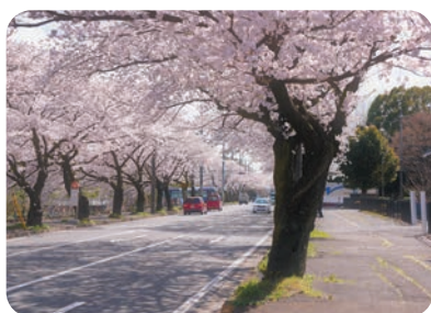
桜 (清久さくら通り)