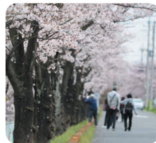
桜(南栗橋スポーツ広場付近)