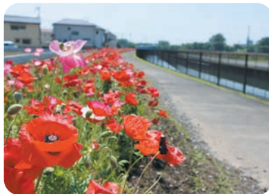
ポピー (コスモスふれあいロード)