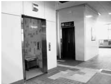
▲バリアフリー化された駅の様子 (上) JR東鷲宮駅 (下) 東武鷲宮駅

と障がい者対応トイレの使用が開始されました。これらにより、高齢者や障がい者をはじめ、駅を利用するみなさんの利便性が一段と高まりました。