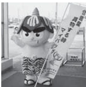
しょうぶパン鬼ーモ マイバッグをPR!