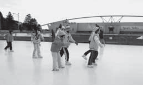
昨年のスケートのつどい