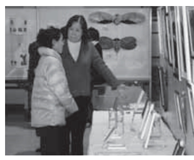
昨年の公民館まつりの様子

◆公民館まつり 日程 2月26日(土)・27日(日) 9時30分～15時 内容 森下公民館で活動しているサークルの作品展示・発表会