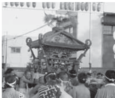
八坂神社の天王様