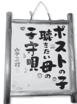
情報紙そよかぜに掲載した川柳

育、文化・芸術の分野などの知識・資格を有する女性 ②社会活動やボランティア活動などに参加し、市政や地域の発展に意欲や関心のある女性 ③女性問題や男女共同参画について詳しい男性または女性 応募期限 6月17日(金) 応募方法・問合せ 登録用紙（人権推進課、または市ホームページからダウンロード可）に必要事項を記入の上、直接または郵送、FAX、Eメールで、人権推進課男女共同参画係（〒346-18501 所在地記入不要 内線2322 / FAX 22-3319 / Eメール jinken@city.kukijg.jp）へ