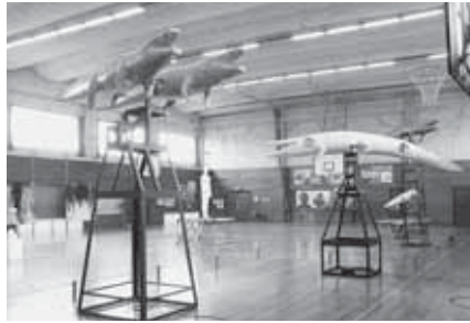
昨年の現代美術展〈分岐点〉の様子

主催 身近で現代美術を見る会 後援 久喜市教育委員会 問合せ 同見る会事務局 木 村 (☎090・5409・8 560) / Eメール bunkiten@ email.plala.or.jp / ホーム ページ http://www.kodakal6.com/bunki_ten_top.htm ※この事業は、平成23年度久 喜市市民活動推進補助金の助 成事業です。