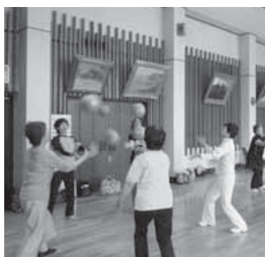
けんこう大学 ボールを使ったウォーミングアップ体操

また、健康づくりへの取り組みについては、保健センターを中心に「けんこう大学」などのさまざまな事業を実施しています。平成23年3月には久喜市の保健事業の日程表を配布しました。その中に掲載している健康講座等の事業に参加していただくことで、健康づくりの実践をお願いしています。健康づくりについては医療費の抑制も大切ですが、長生きをして元気に暮らせることが本当に大切だと思います。今後も関係各課と連携しながら各種事業を実施していきたいと考えています。