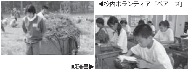
◀校内ボランティア「ベアーズ」