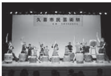
昨年の久喜市民芸術祭の様子

内容 合奏、合唱、和太鼓、フラダンス、ダンス、社交ダンス、吟詠、舞踊、民謡、謡曲、演劇など 入場料 無料 問合せ 生涯学習課文化振興係(内線4287)