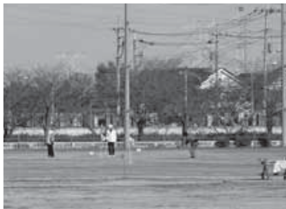
一部利用が再開された 南栗橋スポーツ広場

※安全が確認されたグラウンドA面とゲートボール場は9月から利用できるようにになりました。そのほかについては、平成24年4月の利用再開に向け、撤去した部分の防球ネット新設工事、トイレ工事、芝の張り替え工事の準備を進めています。