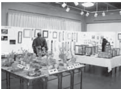
昨年の鷺宮公民館まつり作品展示の様子