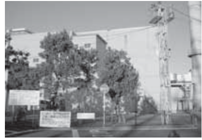
久喜宮代衛生組合