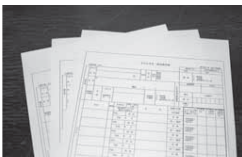
子ども手当認定請求書

問合せ 久喜地区：子育て支援課医療手当係(内線3286) / 菖蒲地区：菖蒲総合支所福祉課(内線916) / 栗橋地区：栗橋総合支所福祉課(内線2336) / 鷲宮地区：鷲宮総合支所福祉課(内線166)