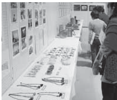
昨年の森下公民館まつりの様子