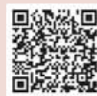
防災行政無線情報