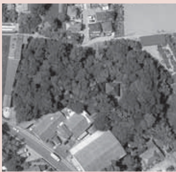
天王山塚古墳(上空から)

天王山塚古墳は、古墳時代以降も永い間、人々の心のよりどころとして、守り継がれてきました。