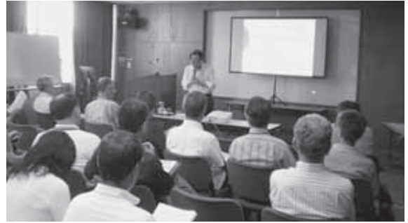
学長（田中市長）の講話

市民大学（まなびすとカレッジ）は、市民の生涯学習活動・ボランティア活動のリーダーとなる人を育てるための2年制の大学（大学院を併設）です。 内容（教育課程） ○久喜市をよく知るための基礎講座 ○広い視野から専門的に学ぶ教養講座 ○生涯学習やボランティア活動の支援方法を学ぶ一般講座・体験活動 学習日時 主に金曜日 19時～21時 ※土・日曜日の講座も年間9～10回 学習場所 主に中央公民館 対象 30歳以上（平成24年4月1日現在）の市内在住者 定員 40人（超えた場合は、各種講座の受講歴を参考に市民大学・高齢者大