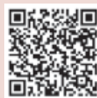
市政・イベント情報