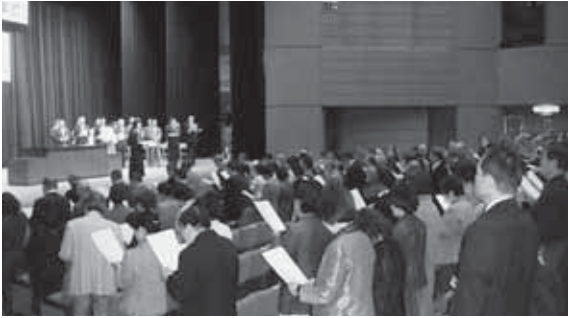
久喜総合文化会館での卒業式

高齢者大学は、高齢者が実際の生活に即した教養を高め、趣味活動や社会参加をすることで生きがいを高めようとする4年制の大学です。 内容 ○市や県の自然・歴史・文学・健康安全・音楽についての学習・現地研修 ○体育祭・発表会・作品展示会などの行事（年間20回程度） ※学習は通常、月・水・金曜日のみ、午前中、行事は1日の場合あり ○クラブ活動やボランティア活動等の自主活動 ※活動日数は個人によって異なります。 場所 主に中央公民館 対象 60歳以上（昭和27年4月1日以前生まれ）の市内在住者で4年間学業