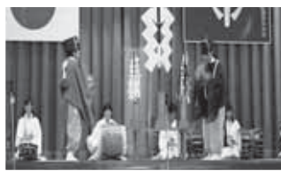
◀ 郷土芸能の催馬楽神楽