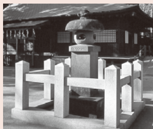
寛保治水碑 (奥は鷲宮神社本殿)

以上が碑文の内容を要約したものです。寛保治水碑は、当時の人々が直面した災害とそこからの復興の記憶を現代の私たちに伝えてくれている貴重な文化財といえます。