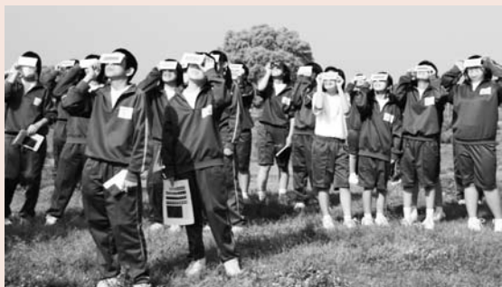
(菖蒲中学校生徒の皆さん)