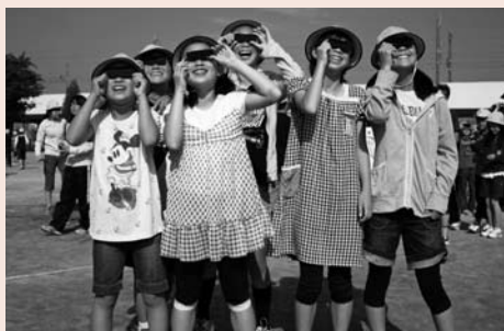
(栗橋南小学校生徒の皆さん)

5月21日(月)、市内各所で金環日食の観察が行われました。市内の多くの小学校では登校時間を早め、太陽の中心部が月に隠れ、細いリング状に見える金環日食を観察しました。また、菖蒲総合支所周辺では、スターウオッチング教室が開催され、近くの菖蒲中学校の生徒が参加しました。