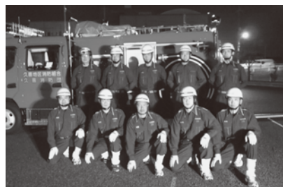
第27回埼玉県消防操法大会出場者の皆さん