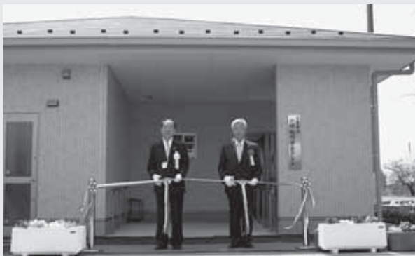
▲栢間小学校で行われた小林・栢間学童クラブ竣工式 (テープカット)