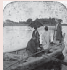
▲利根川渡船の舟 (明治30年代頃)

鉄道や自動車の無かった江戸時代、大量の物資を運ぶ最適な手段は、舟を使った水運でした。利根川やその支流の河川は、多くの舟が行き交う重要な輸送路となっていました。