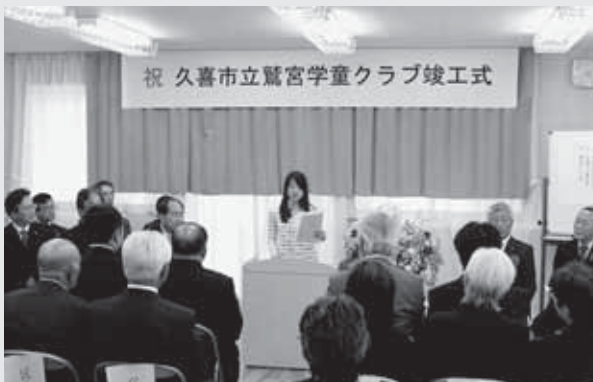
▲鷺宮小学校で行われた鷺宮学童クラブ竣工式 (児童代表のあいさつ)