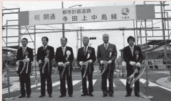
▲テープカットの様子