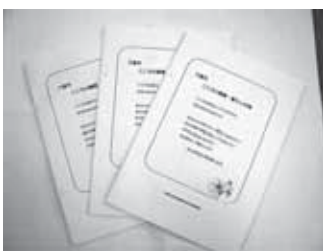
久喜市・こころの健康・暮らし手帳

その一つに、市民が利用できる精神保健福祉サービスを1冊にまとめた「久喜市・こころの健康・暮らし手帳」を作成しました。この手帳には、相談窓口や医療機関、利用できるサービス等が掲載されています。ぜひ活用ください。配布を希望する方は、各保健センターへご連絡ください。