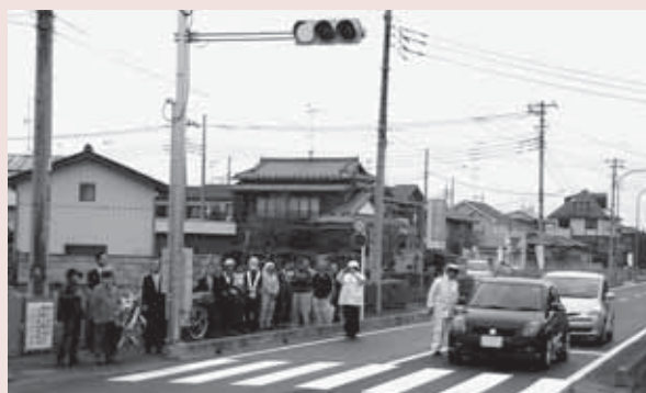
▲信号機灯入れの様子

3月30日(日)、久喜市菖蒲町三箇地内で、「都市計画道路 寺田上中島線開通式」が行われました。