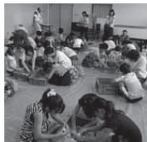
▲子ども歴史広場「勾玉づくり」

10月には「図書館・資料館まつり」を開催し、「昔のおもちゃ作り」「民具・農具の体験」など毎年テーマを変えて実施しています。