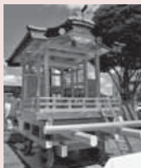
問合せ 自治振興課市民活動推進係（内線2624）