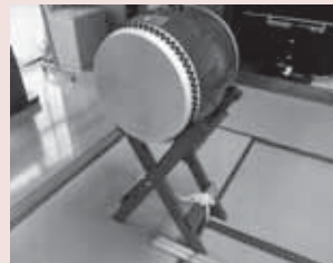
▼菖蒲神輿（神輿の担ぎ棒、飾り紐）