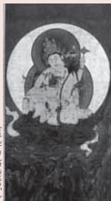
絹本着色如意輪観音像

久喜市菖蒲町菖蒲の袋田山吉祥院は、奈良時代の高僧・行基の開山と伝えられる真言宗智山派の名刹です。