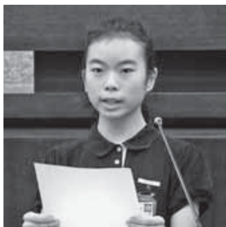
議員 花 河内 久喜小学校6年

また、さらに久喜市をよくするために、少子化や東日本大震災などの自然災害への対応、合併後の新市のさらなる一体化の促進などへの取り組みとして、医療、福祉、環境、教育等の各分野で多くの事業を実施しています。