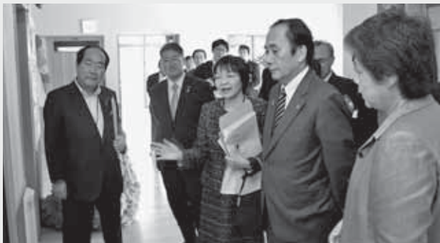
▲市立さくら保育園を見学