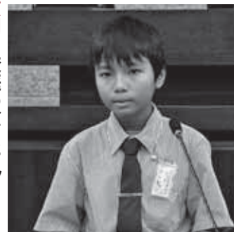
スワンピエソン 議員 菅蒲東小学校6年

今後、「県立菖蒲高等学校跡地」や「栗橋駅西土地区画整理事業地内」に、新たに9か所の公園を整備することを計画しています。