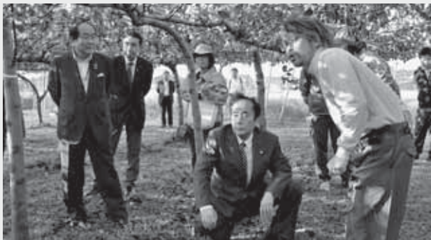
▲矢野農園の梨畑を見学