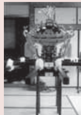
▼東一丁目祭典保存会 (山車土台、車軸等)