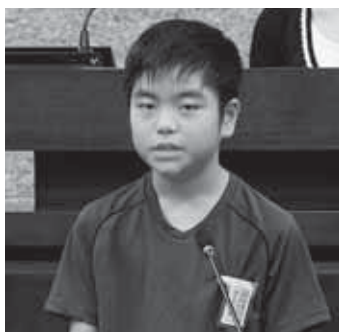
議員 瑞貴 田 諸 青葉小学校6年

【質問】久喜市の自慢できるよいところ、これから改善していかなくてはならないところについて