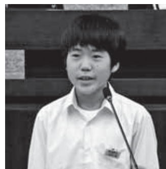
おのてら たかし 議員 栗橋東中学校 3年

そのため、市民、保護者、学校などの代表者が集まって、学校の給食に関して調査や検討をする久喜市学校給食審議会で話し合っていたいただいていますので、今後どのような方法にしていきたいについては、もう少ししばらくお待ちください。