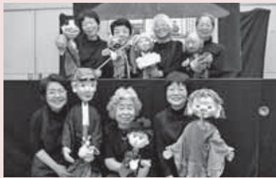
緑綬褒章 (社会奉仕活動功績) 社会福祉施設等奉仕団体「人形劇団久喜どんぐり」の皆さん

昭和59年発足から、30年以上にわたり、市内や近隣市町の保育園・幼稚園・小学校・児童館・高齢者デイサービスセンター等で、人形劇などの公演を精力的に行い、子どもたちの健全育成や高齢者支援地域福祉の推進に尽力されています。