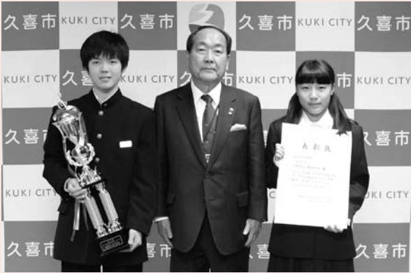
▲日本管楽合奏コンテストに出場した久喜南中学校吹奏楽部の代表生徒

全国大会に出場した中学生が、平成27年11月25日(水)に田中市長を表敬訪問しました。