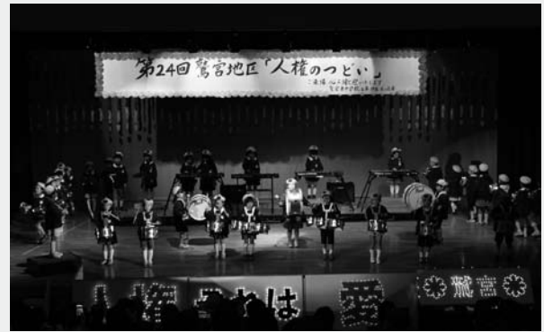
▲鷲宮保育園・鷲宮第二保育園園児による合奏

平成27年12月12日(土)、鷲宮西コミュニティセンター(おおとり)で、第24回鷲宮地区「人権のつどい」が行われました。