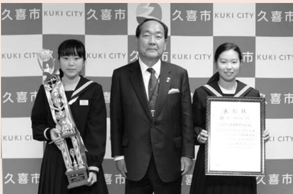
▲全日本マーチングコンテストに出場した栗橋東中学校吹奏楽部の代表生徒