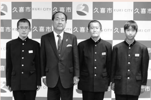
▲文部科学大臣杯小・中学校囲碁団体戦全国大会に出場した鷲宮東中学校囲碁部の代表生徒