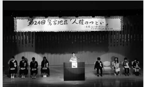
▲小・中学生による人権作文の発表