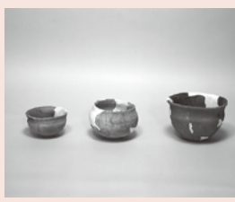
▲鷲宮神社境内遺跡出土土師器

鷲宮一丁目にある鷲宮神社は、鎌倉幕府によって編さんされた歴史書「吾妻鏡」の中にたびたび登場する由緒ある神社です。