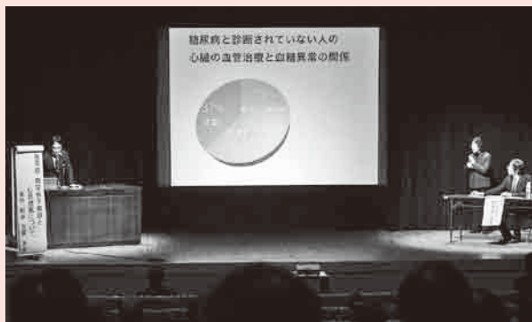
▲糖尿病をテーマにした講演