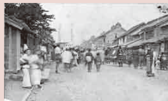
▲明治後期の栗橋の街並み