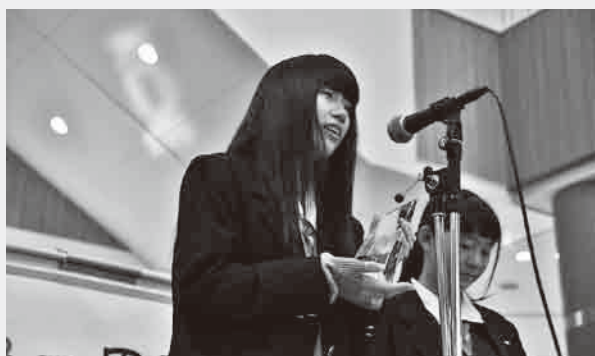
▲表彰式で喜びのコメントをする県立北本高等学校の生徒