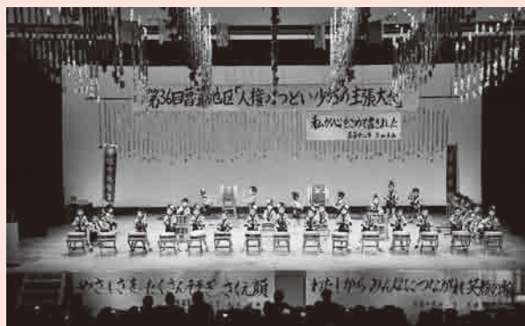
▲幼稚園児による太鼓の演奏

11月12日(土)、菖蒲文化会館(アミーゴ)で、第36回菖蒲地区「人権のつどい・少年の主張大会」が行われました。