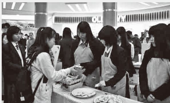
▲来場者に作品を渡している様子