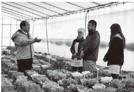
▲シクラメン栽培の説明を受ける様子