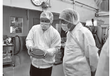
▲生パスタの製造を見学する様子

第1回目の田中製麺(株) (菖蒲町新堀2547) では、生パスタなどの製造の様子を見学した後、麺類全般のほか地元産の農産物を使ったラビオリの開発や地域と連携した取り組みなどの説明を受けました。