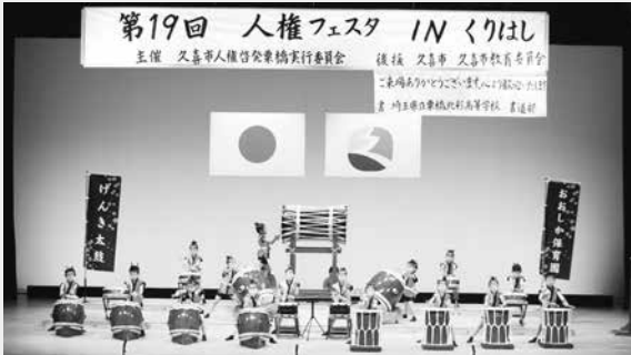
▲おおしか保育園の太鼓演奏