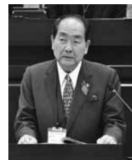
▲答弁する 田中市長