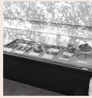
▲中央公民館エントランスホール

久喜中央4丁目の中央公民館付近を中心とする御陣山遺跡では、昭和47年(1972)から平成8年(1996)までに計13回発掘調査を実施しています。