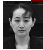
高木美香 議員 (公募)

【答弁】市長 市ホームページに市民活動団体として掲載された団体の会員募集について、広報紙に掲載できますのでご活用ください。なお、団体の会員募集については、区長へお願いすることとは区長の職務が住民と市との連絡調整などであることから、難しいものと考えています。