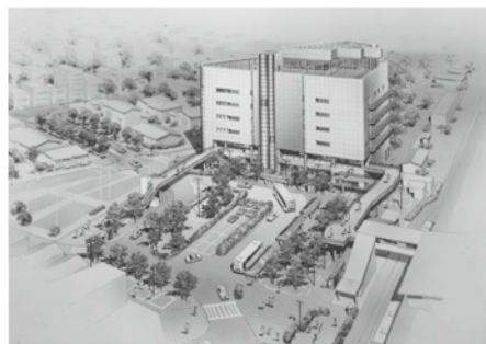
▲再開発事業完成予想図（平成元年ごろ）