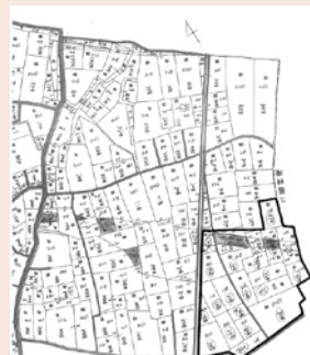
※黒塗りは武州鉄道株式会社が所有していた土地。右下の黒枠内は、現在の菖蒲東小学校の敷地。

大正13年(1924)10月19日から昭和13年(1938)8月22日まで、わずかな期間中央部を縦断する鉄道がありました。当初の計画どおり路線が進まなかったこと、また短命であったことから、「幻の鉄道」あるいは「悲運の鉄道」とも呼ばれています。