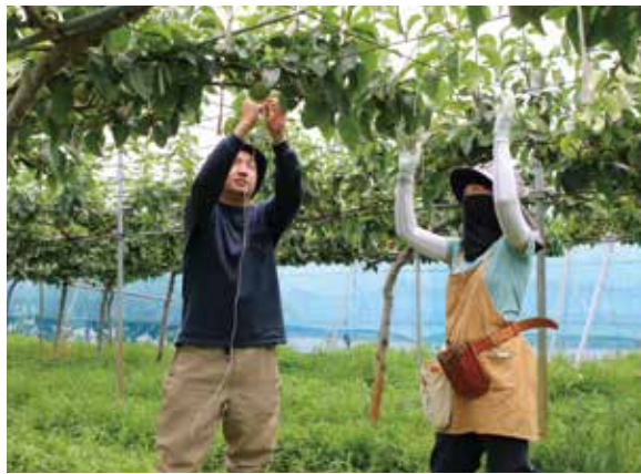
ほとんど夫婦2人で運営しています