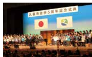
▲合併5周年記念式典の様子