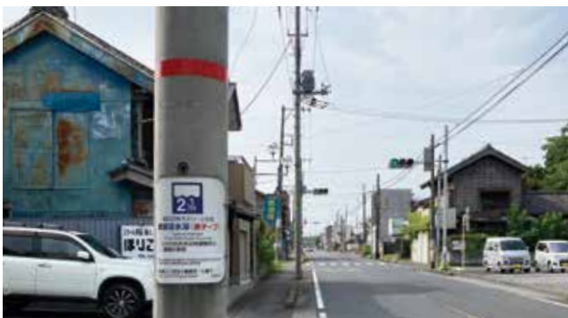
昭和22年に発生したカスリーン台風の際に浸水した地域には、電柱に当時の水位を示すものがあります。

特に、安全を確保するための避難所が「3密」の条件が揃いやすく、感染拡大のリスクが懸念されています。