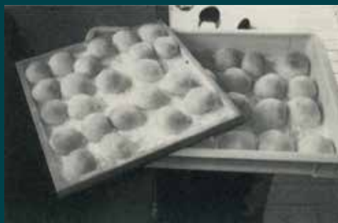
高柳地区の家庭で作られた塩あんびん （『栗橋町史 民俗I』より）

9月に入り実りの秋を迎えるこの時期、新米を楽しみにされる方も多いのではないのでしょうか。久喜市を含む埼玉県内の一部の地域の農家では、収穫を迎えたお祝いの行事をするとき、「塩あんびん」が食されていました。 塩あんびんは小豆のあんを餅で包んだもので、主に埼玉県の北部・東部で食べられてきました。特徴的な点は、あんに砂糖を使わず塩味を効かせていることです。あんに含まれる塩分は小豆やもち米の本来の甘みを引き立たせています。ちなみに、現在主流となっている甘いあんは江戸時代中期に生まれ、