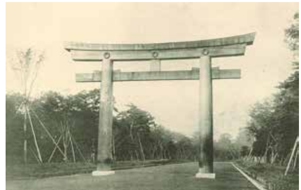
明治神宮造営当時の大鳥居周辺