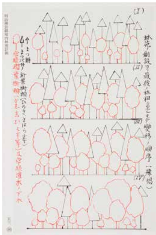
「明治神宮御境内林苑計画」に記された林相変移予想図。上から順に、森が変化する予想が描かれています。