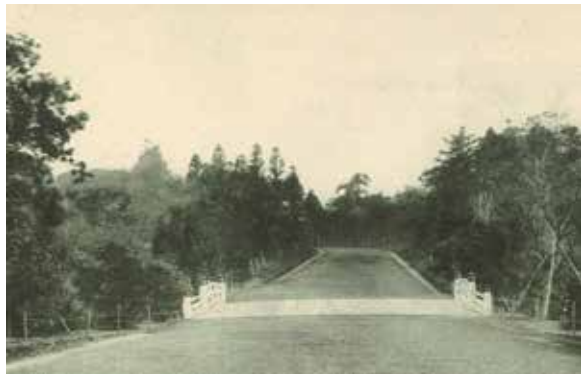
明治神宮造営当時の神橋周辺