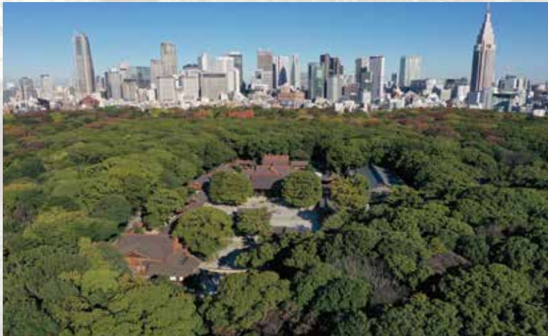
上空から見た明治神宮の杜