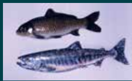
鯉と鮭の進上物(複製)