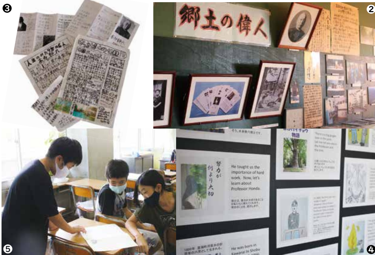
①博士にゆかりがあると伝えられている寄せ植えの松と、園芸委員会の皆さん ②いつでも学習できるようにと整備された資料室 ③今までに子どもたちが作成した新聞 ④英語で説明したパネル ⑤博士についての資料などを読み、学んでいる様子