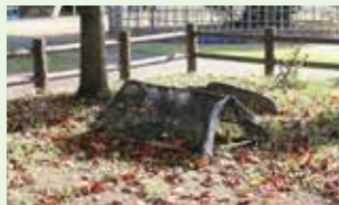
もみの木の実験の様子