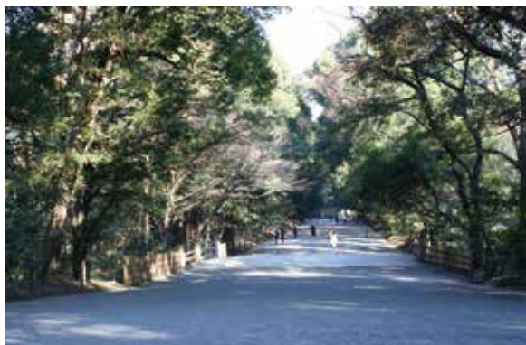
現在の神橋周辺