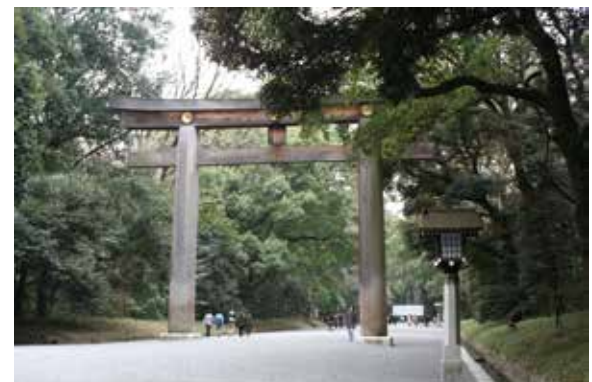
現在の鳥居周辺