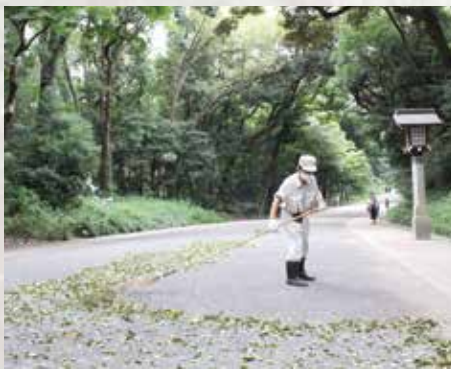
「掃きやさん」が手作りする箒は、砂利を動かさずに落ち葉だけを集めることができます

明治神宮の杜では、「掃きやさん」と呼ばれる職員が毎日参道を清掃し、落ち葉を掃き集めています。集められた落ち葉は、捨てることなく木々の根元にまかれ、森に還されているとのこと。博士の「天然更新」の考えは、こうした日々の森づくりの中にも受け継がれているのです。