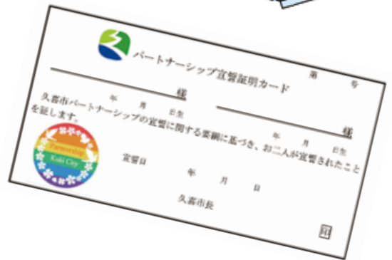
左) パートナーシップ宣誓証明書 上) パートナーシップ宣誓証明カード ※デザインはイメージです。変更となる場合があります。