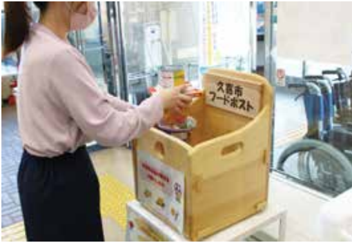
▲市では食品ロス削減を推進するため、郵便局と連携して市内にフードポストを設置。集まった食品は子ども食堂などへ提供しています。

消費と社会のつながりを「自分ごと」として捉え、世界の未来を変えるために、今から行動してみませんか。