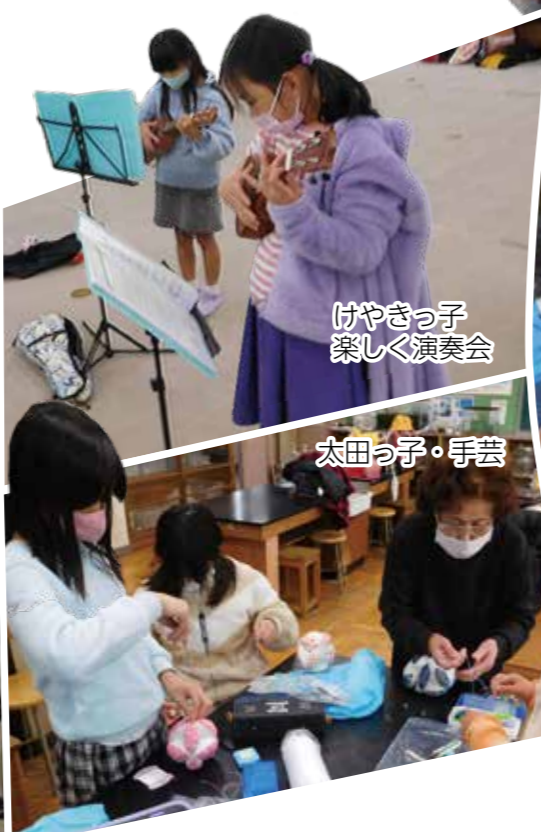
けやきっ子 楽しく演奏会