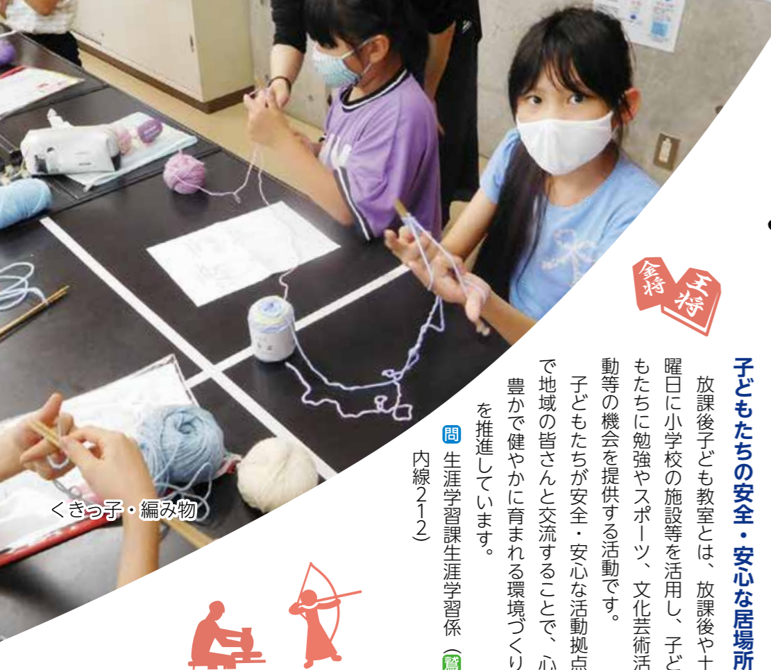
くきっ子・編み物