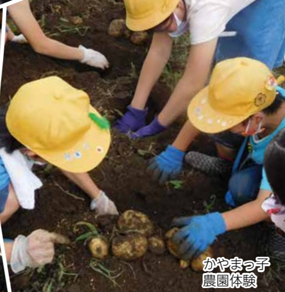
かやまっ子 農園体験