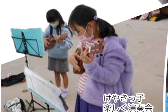
けやきっ子 楽しく演奏会