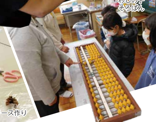
わしの子 そろばん