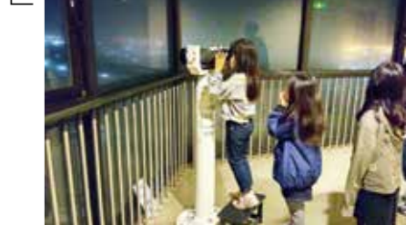
▶三箇ゆうゆうプラザ特別講座「星空観察」