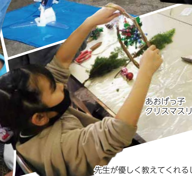
あおげっ子 クリスマスリース作り